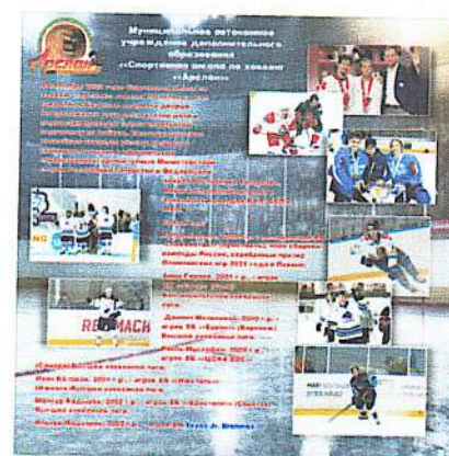
Стенд переносной, устанавливается на улице перед входом в ледовый дворец, в фойе, используется на мероприятиях