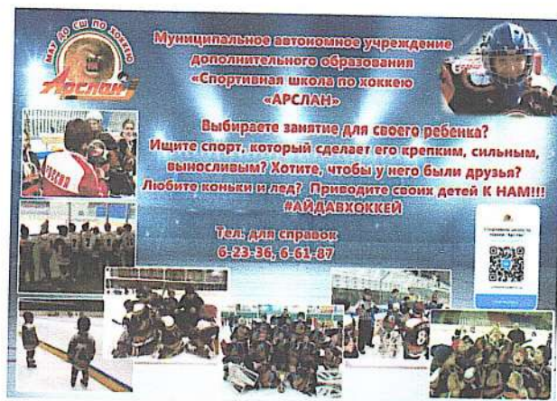
Баннер размещен в городском Детском парке